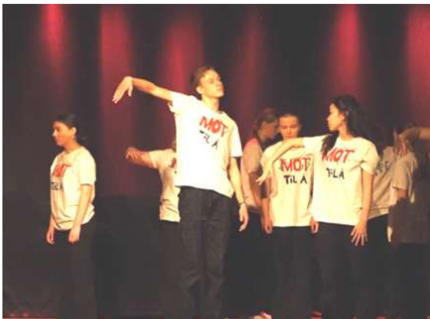
Dansenummer fra forestillingen MOT. Dette er årets kristendomsprosjekt på Vg1