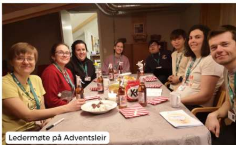
Ledermøte på Adventsleir