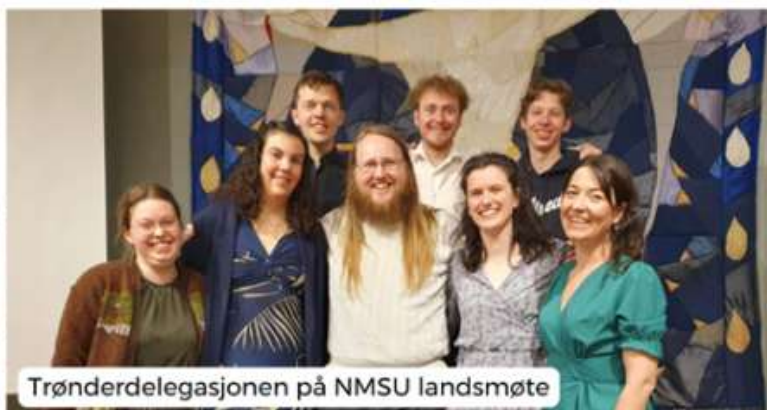
Trønderdelegasjonen på NMSU landsmøte