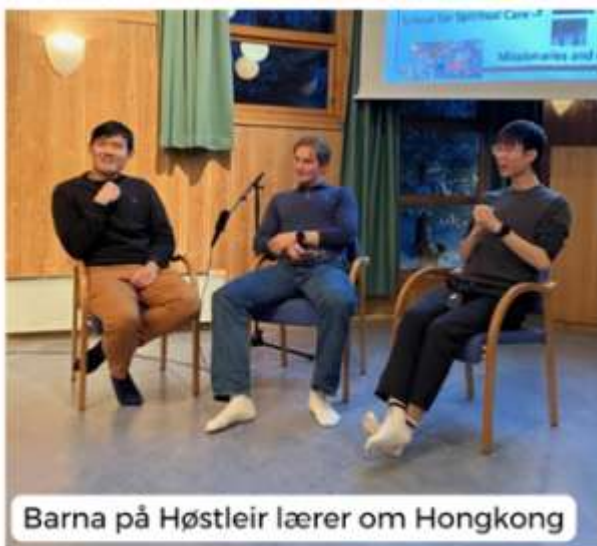
Barna på Høstleir lærer om Hongkong