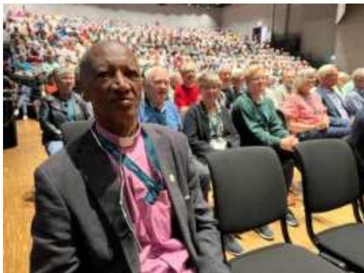
besøk fra vår vennskapskirke i Etiopia. Synodepresident Tamiru Tadese Muleta