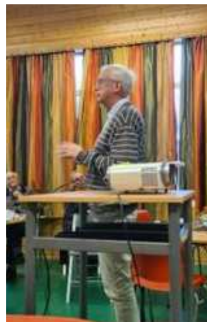
Andakt ved høstfest i Brandsfjord