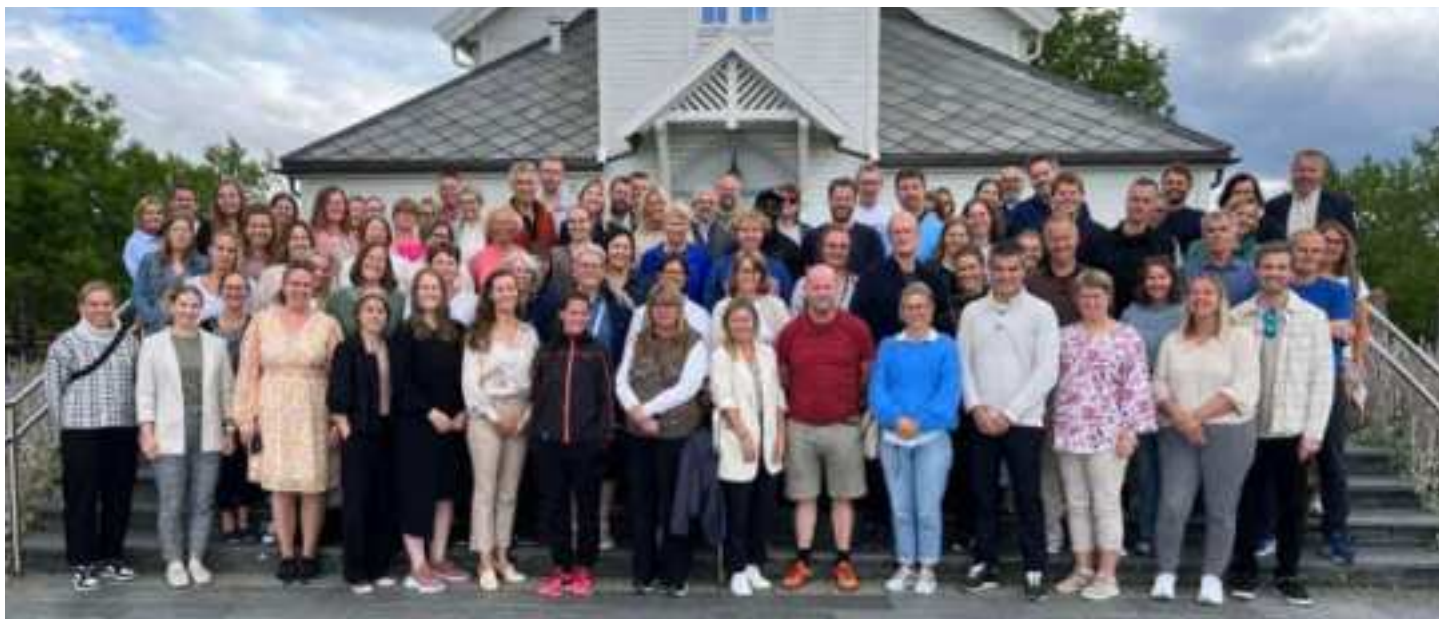
Personalet møtes årlig til en gudstjeneste ved skolestart. Dette bildet er tatt i august 2023, utenfor Tiller kirke.