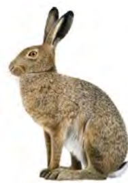
C: en hare