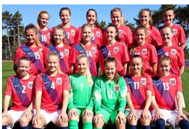
B: et fotballag