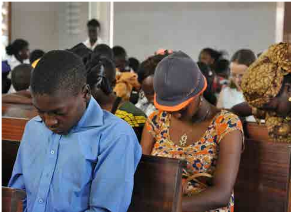
For kristne i Kamerun er bønne viktig. Her er Espace Jeunes (en ungdomsgruppe) samlet til bønnemøte.

- Det ligger en hemmelighet i å be sammen med andre kristne. For når vi ber sammen, oppstår det også et fellesskap mellom oss. På mange måter er bønn en nøkkel til kristent fellesskap.