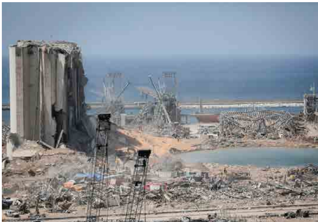
En voldsom eksplosjon i et lager 4. august 2020 ødela store deler av Beirut.

tålmodig i denne situasjonen. Men likevel ber Gud oss om å ikke bli fylt med hat, om å be for fiendene våre og tilgi dem. Gud selv vet hva som er godt for hans barn. Han vil at vi skal leve i fred. Det er ikke lett, men det er Guds vilje.