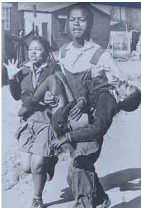
Dette bildet fra 1976 sjokkerte en hel verden. 11 år gamle Hector Pieteron er skutt og drept av politiets kuler. Storesøster Antoinette, som løper ved siden av, er bunnløst fortvilet.

i Soweto måtte lære boerspråket afrikaans i skolen. Demonstrasjonen samlet flere enn arrangørene hadde