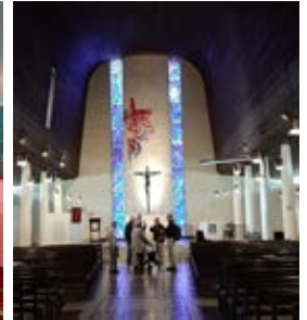
Misjonsvenner på omvisning i Weidemannkatedralen.