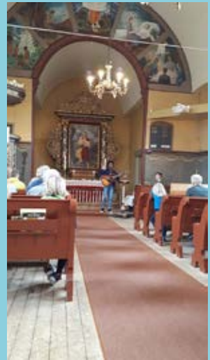
Samling i Strinda kirke.