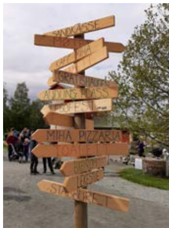
Dette skiltet sier noe om alt man kunne gjøre denne dagen.

Dagen var ikke bare fylt av kjøp og salg, men også møter og konsert. I god misjonsånd møttes vi også rundt Guds ord. De yngste fikk være med på pop-up-leir i regi av NMSU.