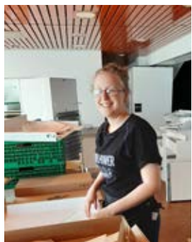
Dugnadsarbeid med ett smil!

Det er ikke til å legge skjul på at lokalene bærer preg av at det er en stund siden siste