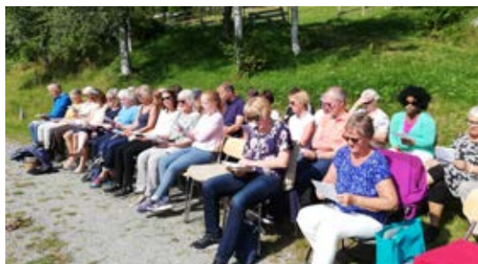
Ca. 40 personar samla til misjonsstemne på Åkerfallet, ein fjellgard på Meisingset i Tingvoll