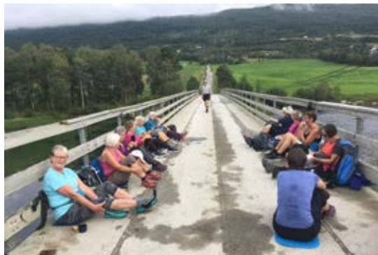
Lunsj på en av bruene over Gudbrandsdalsloggen

Den tredje vandringsdagen fikk vi nydelig vær, de to foregående dagene hadde vi fått noen regnbyger, men ellers greit vandringsvær. Vi ble kjørt tilbake der vi slutta gårsdagens vandring og vandra mesteparten av denne dagen langs bredden av Gudbrandsdalslågen. Etter Lesja sentrum vandra vi et godt stykke oppe i lia og hadde utsikt over Gudbrandsdalen og Reinheimen.