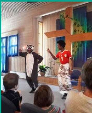
Man møter mange forskjellige når man er på leir.