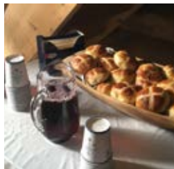
Kirketjeneren overraska oss med deilig saft og nysteikte boller med kors.