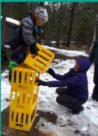
Her stables det i høyden.