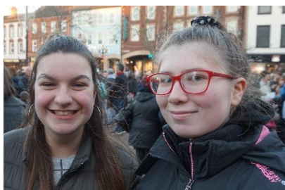
To av de eldre jentene våre

allerede involvert i Network Youth Church, men kanskje med disse jentene kan vi starte opp noe a la Network Young Adults Church, som ungdommene kan vokse inn i.