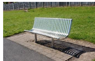
Benken vår i parken

Selv om vi selvfølgelig ikke ønsker at noen barn og ungdommer skal holdes utenfor, og vi ønsker at alle som vil skal få lov til å være sammen med oss, var det interessant å merke seg at kjerneungdommene føler seg at tilhørighet til "klubben", til oss, til parken og til fellesskapet vi har der sammen. For dem er det mer enn bare en time eller så hvor de henger i parken; for dem er det tid sammen i klubben.