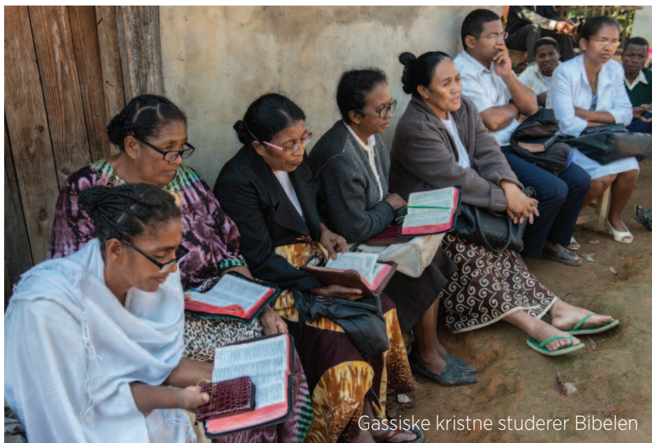
Gassiske kristne studerer Bibelen